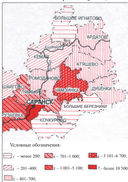
Р и с. 2. Инвестиции в основной капитал по районам восточной части Республики Мордовия в 2013 г., тыс. руб.

С целью решения хозяйственных проблем района особое внимание следует уделять инвестированию, без чего развитие всех сфер на начальных стадиях значительно затрудняется. К сожалению, инвестиции в основной капитал в настоящее время невелики – по этому показателю район занимает одно из последних мест в восточной части Мордовии (рис. 2).