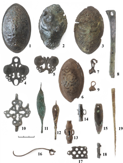
Р и с. 3. Терву-Линнасаари. Предметы из цветного металла: 1–3, 6 – фибулы; 4, 5, 10 – цепедержатели; 7, 9 – подвески-бубенчики; 8 – оковка ножен; 11, 12 – копоушки; 13, 14 – Ф-образные пронизки; 15 – блесна; 16 – игла от фибулы; 17, 18 – наременные накладки; 19 – изделие непонятного назначения

При раскопках древнекарельских городищ обнаружена значительная коллекция ювелирных изделий, использовавшихся для украшения женской одежды (рис. 3).