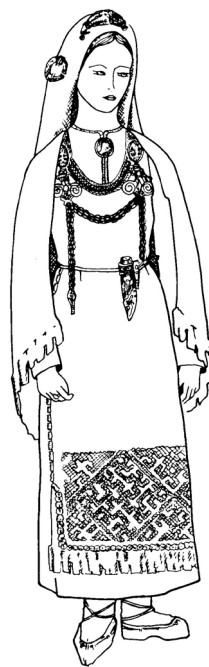
Р и с. 1. Женский костюм из Кекомьяки-1

Как нам удалось выяснить в результате реконструкций нескольких женских костюмов XIII–XIV вв. по материалам могильников Карельского перешейка (4, рис. 16–17), у представителей одного и того же этноса по разным причинам, в том числе по возрастному признаку, наблюдаются различия и в наборе элементов одежды, и в цвете, и в составе украшений. Например, одна из двух женщин, погребенных в могиле Кекомьяки-1 (рис. 1), была одета в тонкую льняную рубаху, отделанную тесьмой с серебряной нитью и застегнутую у ворота орнаментированной пластинчатой фибулой карельского типа. Поверх нее было надето белое шерстяное окаймленное красно-черной узорчатой тесьмой без рукавов одеяние, закрывающее весь корпус и скрепленное на плечах овально-выпуклыми фибулами; к ним были прикреплены Ф-образные пронизки с привесками, спиралевидные держатели цепей, от которых спускались железные цепи, заканчивающиеся с правой стороны копоушкой, с левой – ножом с орнаментированной рукоятью в ножнах. Темно-серый передник, украшенный полосой из бронзовых спиралек, составляющих сложные композиции, представляет собой лучший