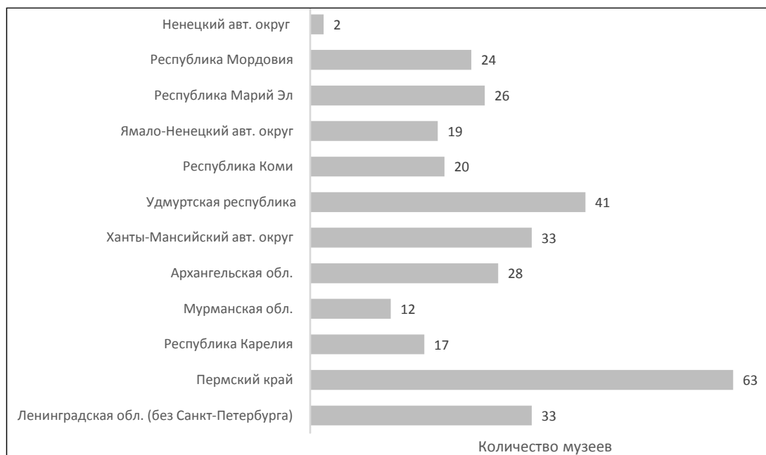
Рис. 2. Характеристика музеев в регионах с финно-угорскими народами (по данным сервера отраслевой статистики Минкультуры РФ за 2016 г. – www.mkstat.ru )

Fig. 2. Characteristics of museums in the regions with Finno-Ugric peoples (according to the server data of industrial statistics of the Ministry of Culture of the Russian Federation for 2016 – www.mkstat.ru )