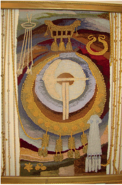
Рис. 3. Л. Д. Левина. Ожерелье времени. Гобелен, ткачество (2006 г.). 80×90