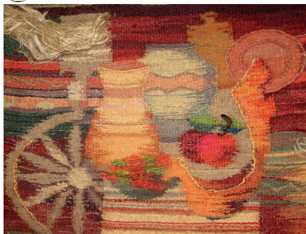
Рис. 1. Л. Д. Левина, О. Е. Колмогорцева. Родные мотивы. Гобелен, ткачество (1987 г.). 120×160