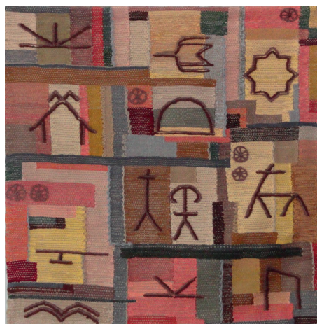
Рис. 2. Л. Д. Левина. Тешкст. Гобелен (2011 г.)