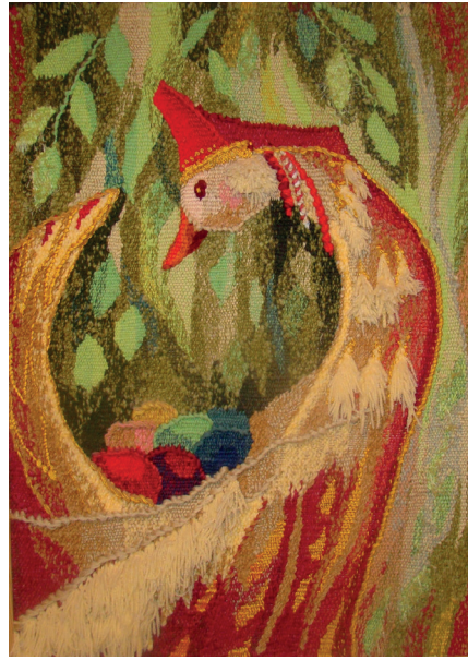
Рис. 4. Л. Д. Левина. Иненармунь. Ткачество, гобелен (2004 г.). 60×80