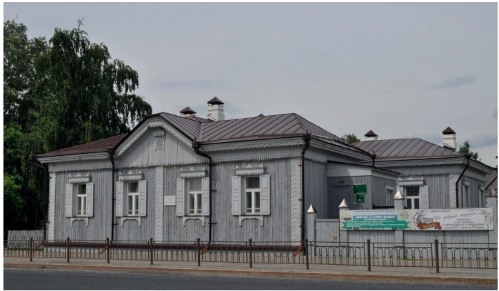
Музей истории освоения и изучения Сибири им. А. А. Дунина-Горкавича (г. Тобольск)

В 2010 г. в Тобольске был организован Музей истории освоения и изучения Сибири им. А. А. Дунина-Горкавича как струк-