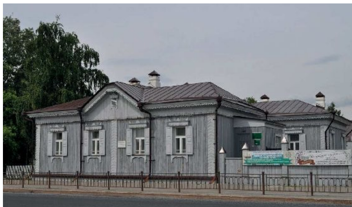
Музей истории освоения и изучения Сибири им. А. А. Дунина-Горкавича (г. Тобольск)

В 2010 г. в Тобольске был организован Музей истории освоения и изучения Сибири им. А. А. Дунина-Горкавича как структурное подразделение Тобольской комплексной научной станции Уральского отделения РАН.