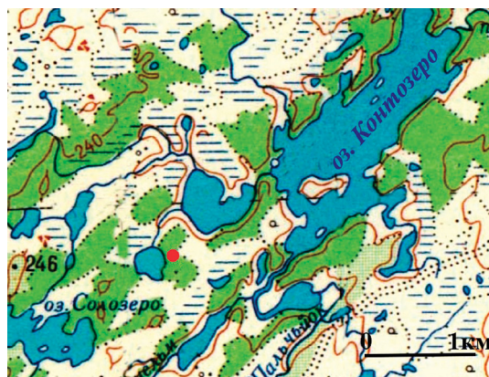
Рис. 1. Местонахождение часовни Рождества Христова на озере Чесыньявр

ведена ее фотофиксация (купол и крыша здания еще сохранялись) (рис. 2, 3), описаны уцелевшие церковные предметы и надписи XX в. на бревнах стен. Первично собранная информация приобрела особую ценность после обрушения часовенной крыши [9]. Экспедиционные работы 2002 г. вызвали общественный интерес, способствовавший активизации изучения этой православной святыни. В последующие годы продолжались изыскания по сбору документальных материалов по истории часовни.