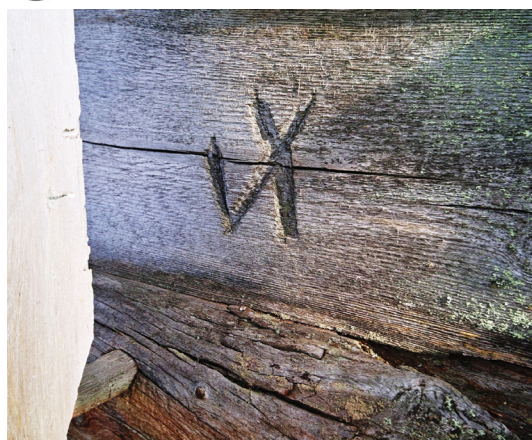
Рис. 7. Часовня на озере Чесыньявр. Тамга Fig. 7. The Chapel on Lake Chesynyavr. Tamga