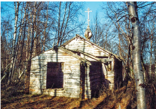
Рис. 3. Часовня на озере Чесыньявр. Вид с юго-запада