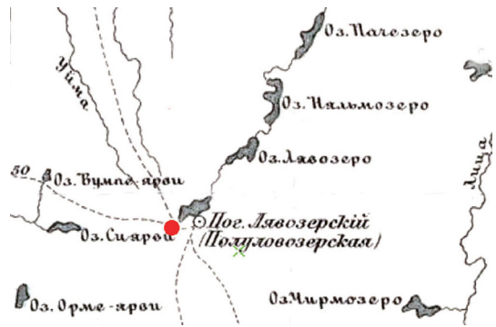
Рис. 4. Местонахождение часовни Рождества Христова на озере Чесыньявр Военно-дорожная карта Европейской России, 1888

Он же упоминает часовню и в 1834 г.: «Семиостровской же называемой Лявозерской, при коем часовня во имя Рождества Христова» 8 (рис. 4). К 1840 г. относится первое описание ее размеров и внутреннего убранства: «Часовня сия от города Колы отстоит в 295 верстах, местоположением имеет лес. От зимнего Лявозерского погоста в 1,5 версте. Длина часовни 5,5 аршина, а широта 5,5 аршина же, а высота 2,5 аршина. Одно окно. Из икон: 1. Рождество Христово, 2. Неопалимая Купина, 3. Благовещенье Пресвятой Богоро-