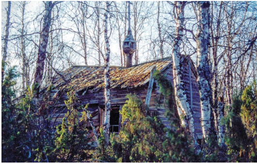
Рис. 2. Часовня на озере Чесыньявр. Вид с северо-запада

полом в центре часовни были обнаружены пять камней, которые, скорее всего, можно рассматривать как «закладные». Это позволяет предположить, что в этом месте устраивался престол, и в редкие приезды священников служилась Божественная Литургия [9]. Кроме того, в 2019 г. архитектором-реставратором О. В. Берсневым произведены натурные обмеры здания, с составлением чертежей и детальным описанием его конструктивных особенностей.