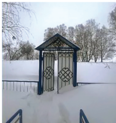
Рис. 3. Вход в рощу Султана Керемета, Башкортостан, ПМЭ, 2023.

Описываемый тип объектов отличается близостью к живому обитаемому ландшафту. Посещение памятников не табуировано и не ограничено рамками молитвенного ритуала, сезонностью. Более того, некоторые памятники содержат следы повреждений, хотя осквернение их не одобрено социумом. В отличие