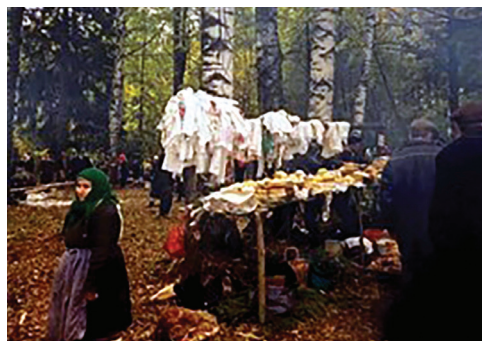
Рис. 1. Моление в деревне Куприян-Сола, Марий Эл, 1995. Материалы экспедиций кафедры этнологии. Автор изображения: Т. Л. Серебренникова Fig. 1. Prayer in the village Kuprian Sola, Mari El, 1995. Materials of expeditions, Department of Ethnology. The author of the image: T. L. Serebrennikova

Рощи, в которых проходят мировые моления включают несколько молельных площадок, предназначенных для обращения к нескольким богам. Так, в роще для всемарийских молений в Советском районе есть несколько онапу , посвященных разным богам: Тун Юмо (Божество Вселенной), Мер Юмо (Бог общины), Курык Кугыза (Хозяин Горы), Шочын Ава (Богиня Рождения) и др. По словам местного карта, каждому божеству предназначается отдельная жертва в виде животных или продуктов питания 17 . Возле каждого онапу обычно сооружается стол из сосновых веток ( шиллык ), божеству посвящается отдельный костер 18 .