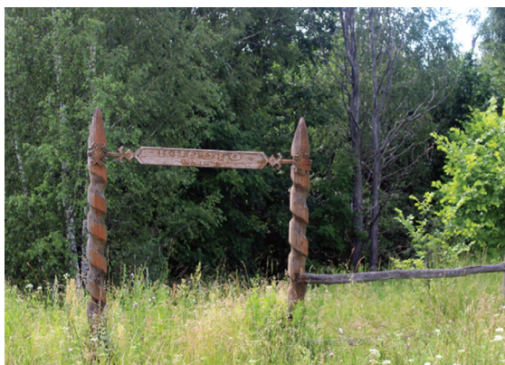
Рис. 2. Вход в священную рощу, Марий Эл, ПМЭ, 2022. Автор изображения: Г. Ю. Устьянцев Fig. 2. The entrance to the sacred grove, Mari El, PME, 2022. The author of the image: G. Yu. Ustyantsev

В фольклоре божеств могут описывать как антропоморфных персонажей, наблюдаемых рядом со священным местом. В следующем фабулате хозяина горы визуализируют как старца с белой бородой: «Муж моей сестры рассказывает. Он охотник. Раню утром он пошел на охоту в сторону горы. <...> Дорога выходит в поле. А там, говорит, туман, прям как молоко. Ничего не видно. И какая-то движуха, говорит. Туман движется в мою сторону и закручивается