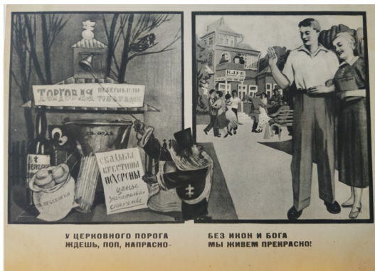
Р и с. 2. М. М. Черемных «У церковного порога ждешь, поп, напрасно!» Плакат. F i g. 2. M. M. Cheremnykh “You wait in vain at the church threshold, priest!” Poster.