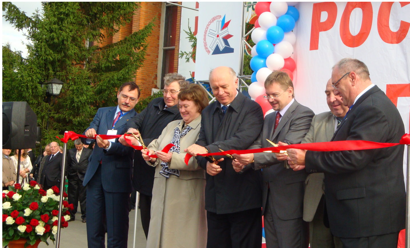
Выставка «Вперед, Россия!». Мордовэкспоцентр, Саранск, 2009 г.