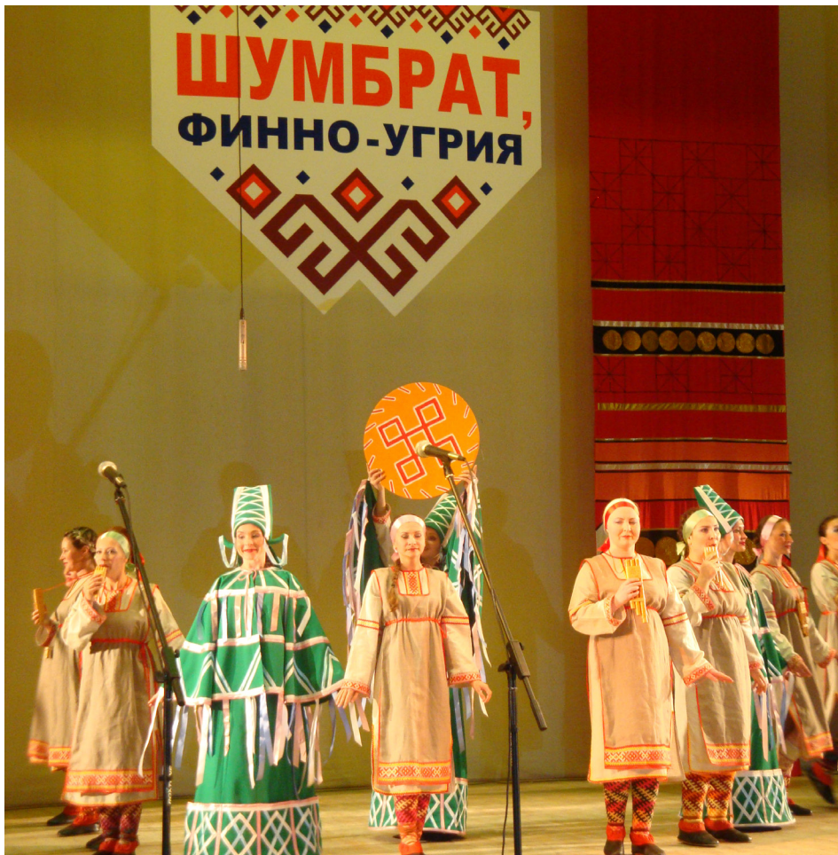
Международный фестиваль национальных культур финно-угорских народов «Шумбрат, Финно-Угрия!». Саранск, 2009 г.

На IV съезде говорили о том, что в Саранске, в МГУ им. Н. П. Огарева, создается центр финно-угроведения и завершается строительство учебного комплекса института национальной культуры, отличные условия для проживания студентов, аспирантов, представителей мордовской диаспоры обеспечит общежитие европейского уровня. Это будет как раз следствием работы IV съезда.