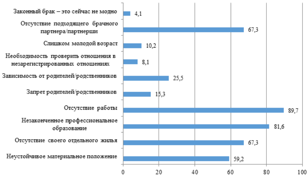
Рис. 1. Причины, по которым респонденты не вступают в законный брак, %